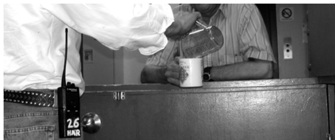
Programme de réduction des dommages chez les Bergers de l'espoir

L'étude conclut que l'expression « difficile à loger » devrait être bannie de notre vocabulaire puisque ces initiatives ont démontré que les sans-abri, même s'ils ont des besoins complexes et vivent dans la rue depuis longtemps, peuvent être logés avec succès dans un logement permanent lorsqu'on leur offre le soutien dont ils ont besoin et qu'ils veulent bien recevoir. Si des solutions ont pu être trouvées pour mettre fin à l'itinérance chez cette clientèle, alors les éléments clés qui différencient les organismes étudiés, tels que la priorité accordée au logement et l'approche centrée sur le client, peuvent être appliqués pour mettre fin à l'itinérance pour d'autres personnes qui n'ont pas d'endroit où vivre.